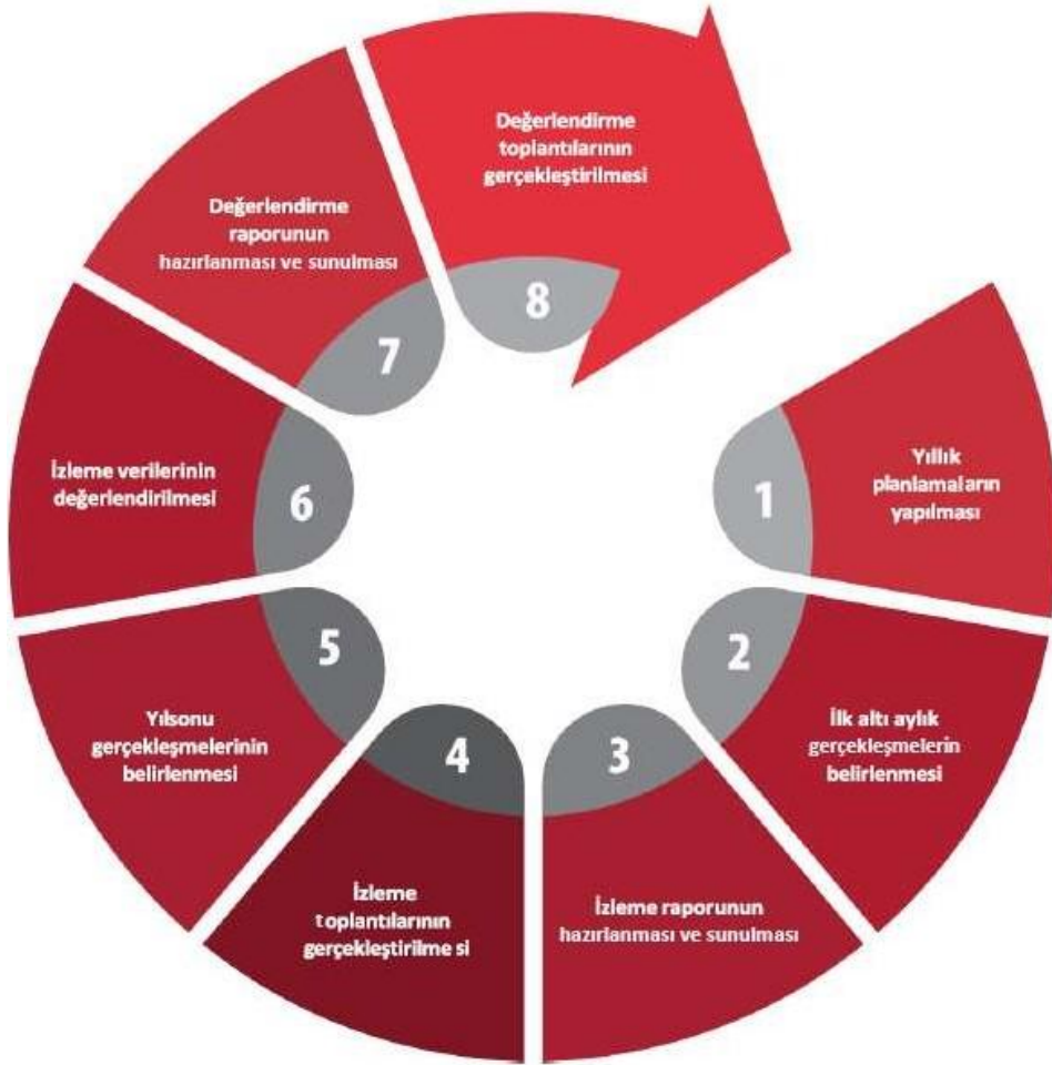
Şekil: İzleme ve Değerlendirme Süreci

İzleme ve değerlendirme sürecinin işleyişi ana hatları ile aşağıdaki şekilde özetlenmiştir: 2024–2028 Stratejik Planı'nda yer alan performans göstergelerinin gerçekleşme durumlarının tespiti yılda iki kez yapılacaktır . Ara izleme olarak nitelendirilebilecek yılın ilk altı aylık dönemini kapsayan birinci izleme kapsamında tüm amaç sorumluları, sorumlu oldukları göstergelerle ilgili gerçekleşme durumlarına ilişkin veriler “Stratejik Plan Sorumlu Müdür Yardımcısı” tarafından toplanarak performans hedeflerinin gerçekleşme durumları hakkında hazırlanan “Stratejik Plan İzleme Değerlendirme Raporu” okul müdürüne sunularak paydaşlarla paylaşılacaktır. Bu aşamada amaç; varsa öncelikle yıllık hedefler olmak üzere, hedeflere ulaşılmasının önündeki engelleri ve riskleri belirlemek ve yıllık hedeflere ulaşılmasını sağlamak üzere gerekli görülebilecek tedbirlerin alınmasıdır.